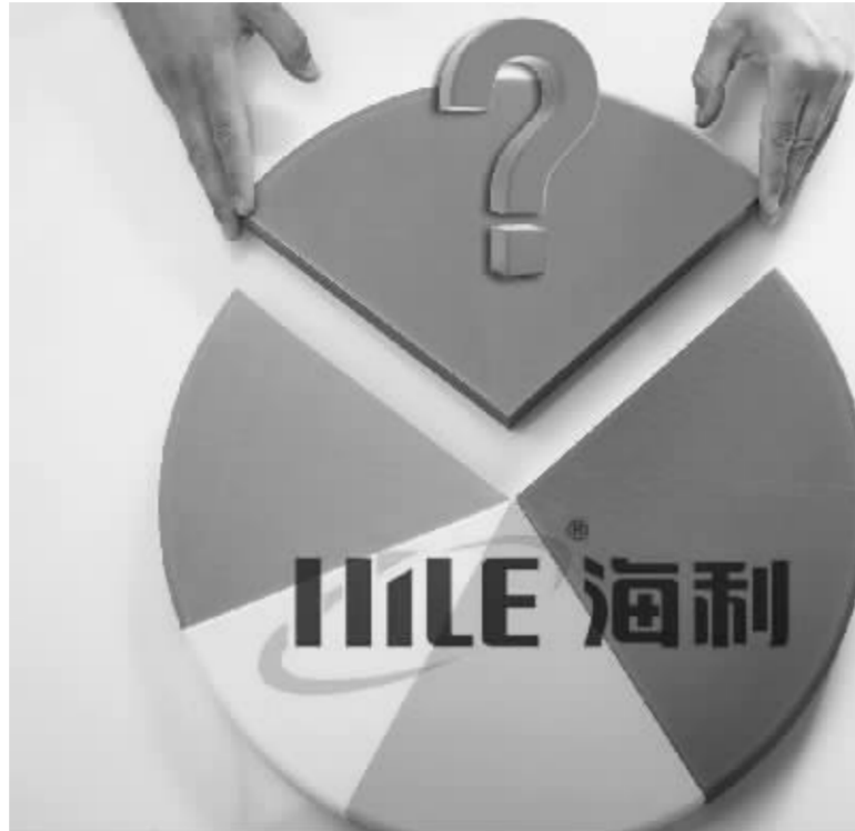
海利生物扣非净利润增速情况