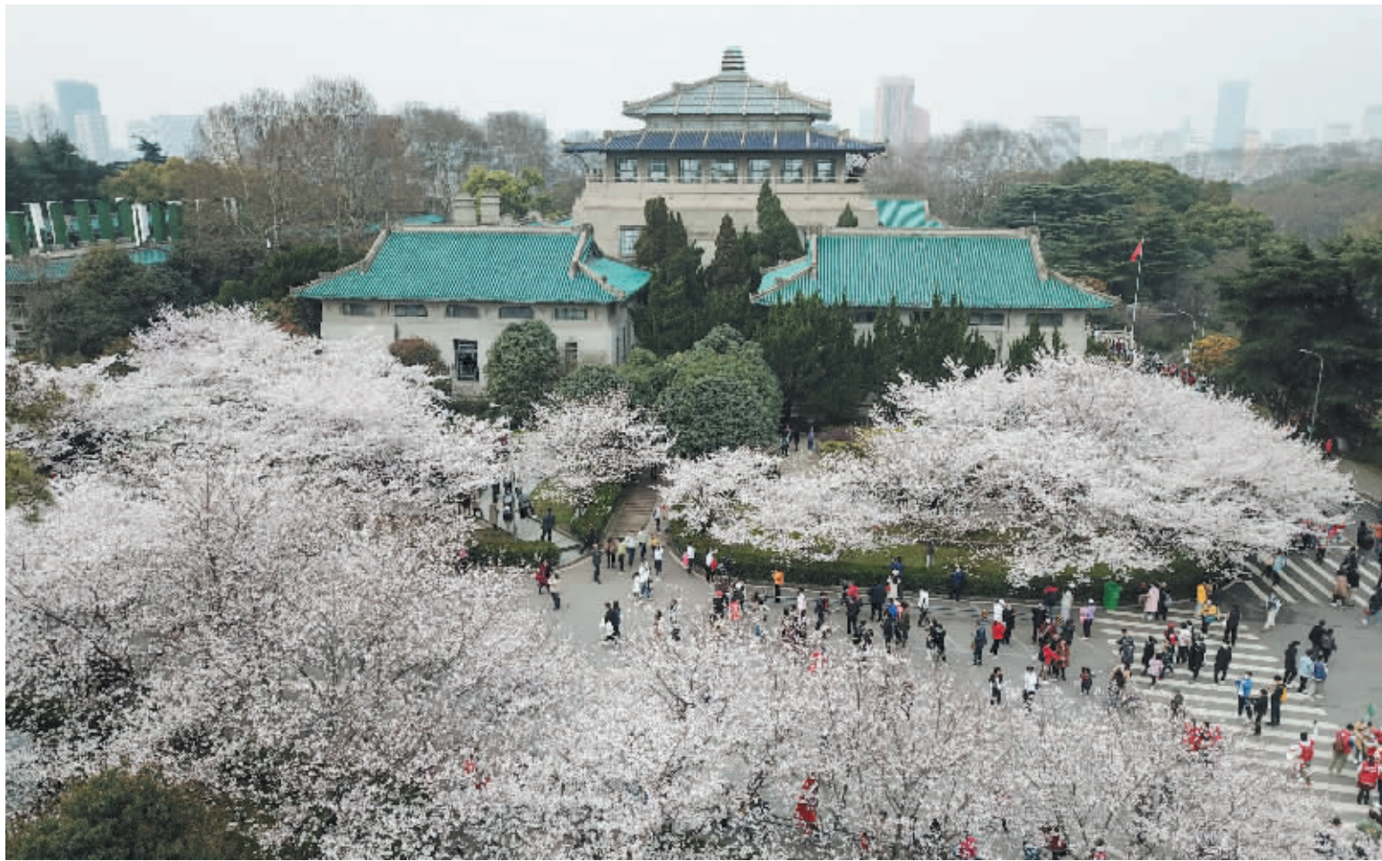
武汉大学邀请抗疫英雄赏樱。3月13日，来自各地的援鄂医护人员在武汉大学校园共赴樱花之约。

数控机床龙头企业华中数控，2020年也交出了一份优异的成绩单，公司全年实现营业收入13.22亿元，同比增长46%；实现净利润2777万元，同比增长81%。业绩增长主要来自