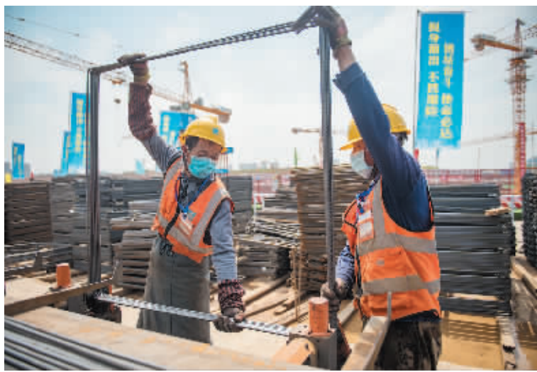
建设者在武汉光谷大悦城建设工地作业。