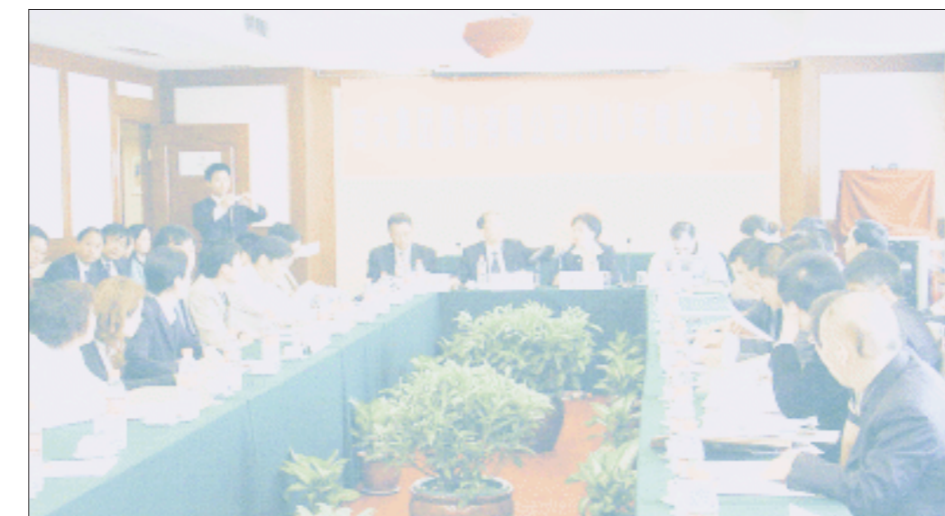
代表股份数量上的“寡不敌众”让“银泰系”依然站在百大董事会的门外

百大集团在发展过程中出现反复,希望股东之间商量好了之后再提交到董事会讨论。”由此似乎不难看出,“银泰系”重组百大虽是众望所归。然而从代表股份数量上,“银泰系”显然寡不敌众。股东大会结束后,“银泰系”代表一言未发地离场。专程从北京总部前来参会的投资总监,连午饭也没吃就赶往机场。