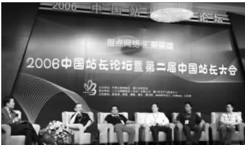
4月25日,2006中国站长论坛在福建厦门举行

据了解,51.com 的主要收入来自于类似于网络游戏的虚拟物品交易和一些其他服务产生的电信增值业务,不过庞升东表示,目前还处于研发投入阶段,主要任务是扩大用户群和增强用户体验。