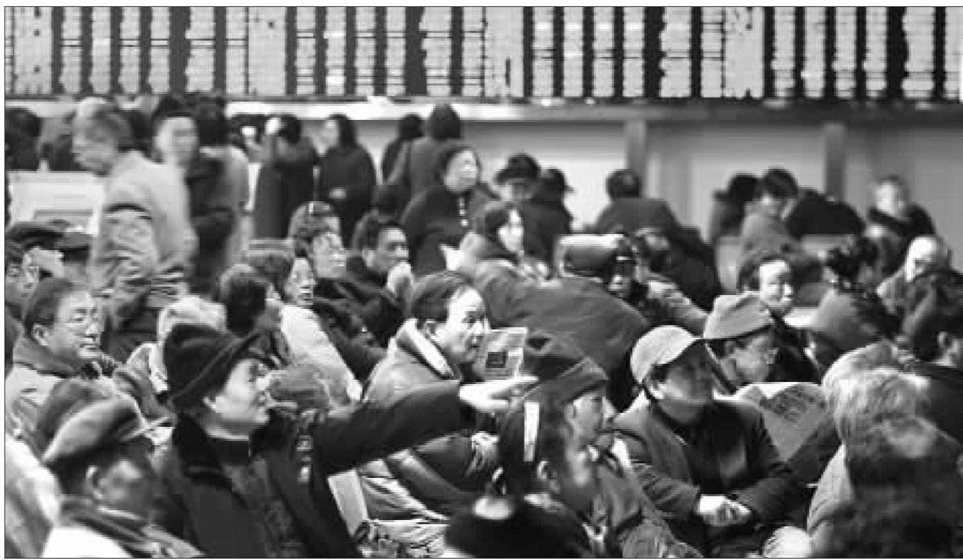
QFII 用实际行动证明其对 A 股市场看法的日趋乐观

截至昨日,证监会批准的 QFII 机构已达 40 家,外汇局已批准 34 家 QFII 的投资额度,总计 65.7 亿美元。