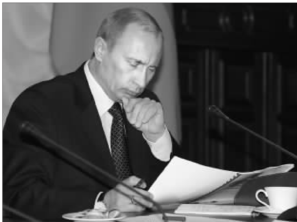
4月26日,俄罗斯总统普京在西伯利亚联邦区州长会议上阅读文件

专家指出,从俄欧之间的能源争端可以看出,俄罗斯正试图在欧洲和中国两大市场之间左右逢源,而横跨欧亚的地理位置也给了俄罗斯这样的有