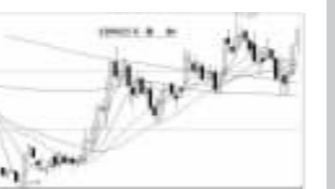
三剑客昨日荐股成绩