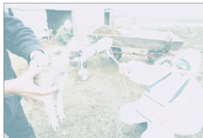
一名白俄罗斯工作人员在切尔诺贝利核电站隔离区内测试核辐射强度