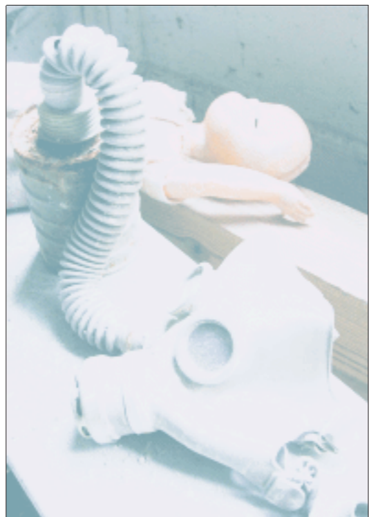
在切尔诺贝利核电站30公里隔离区内,一个洋娃娃和一个防毒面具遗留在一所荒废的幼儿园里