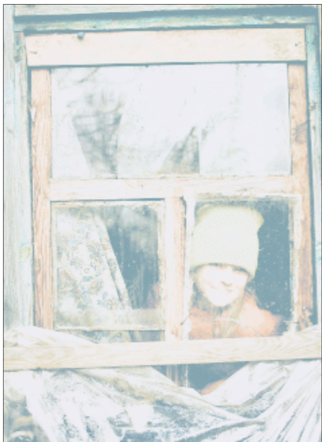
在切尔诺贝利核电站隔离区附近的村庄佐林,一名乌克兰女孩从屋内向窗外望去