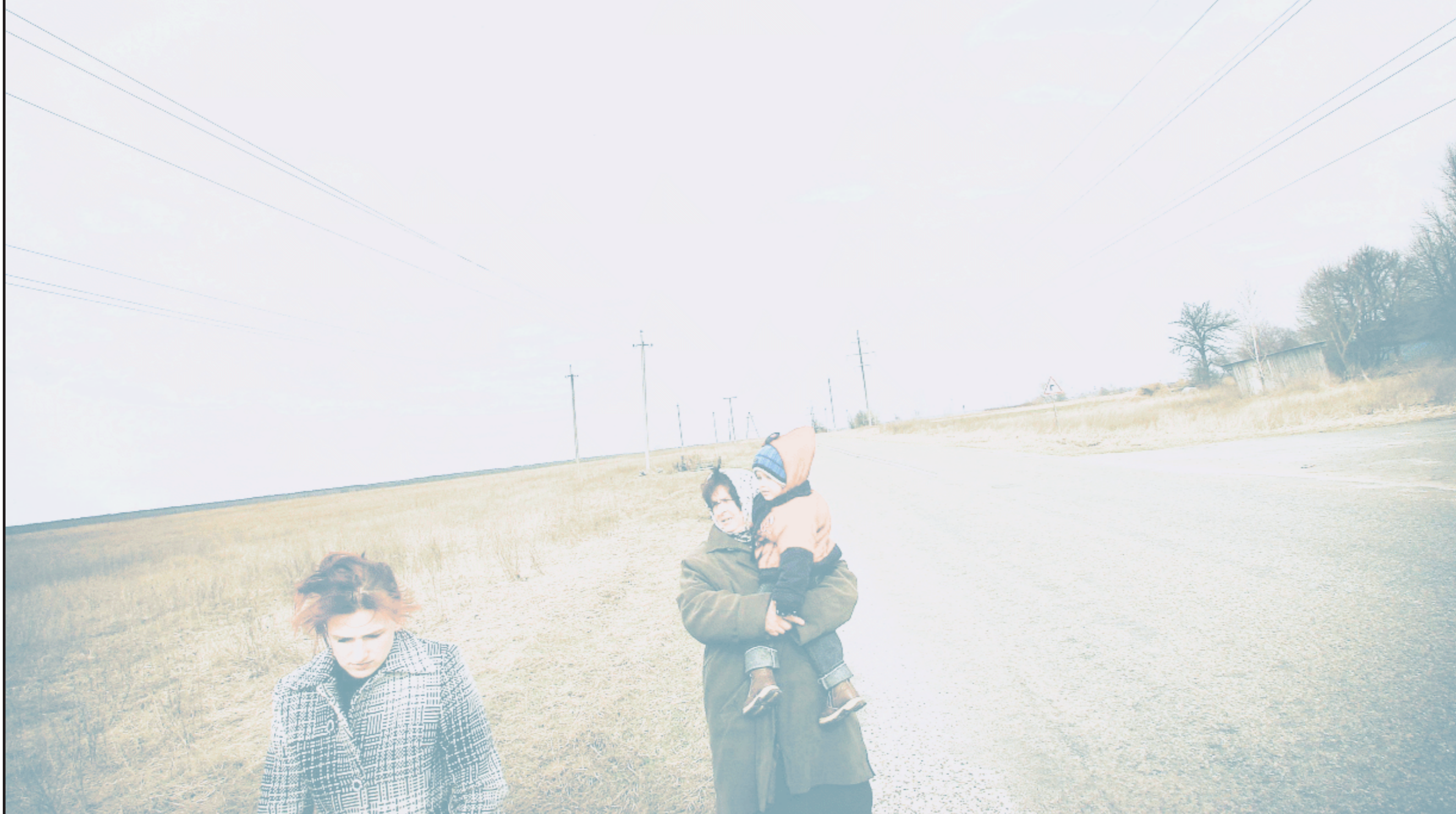
乌克兰当地居民在切尔诺贝利核电站隔离区附近候车