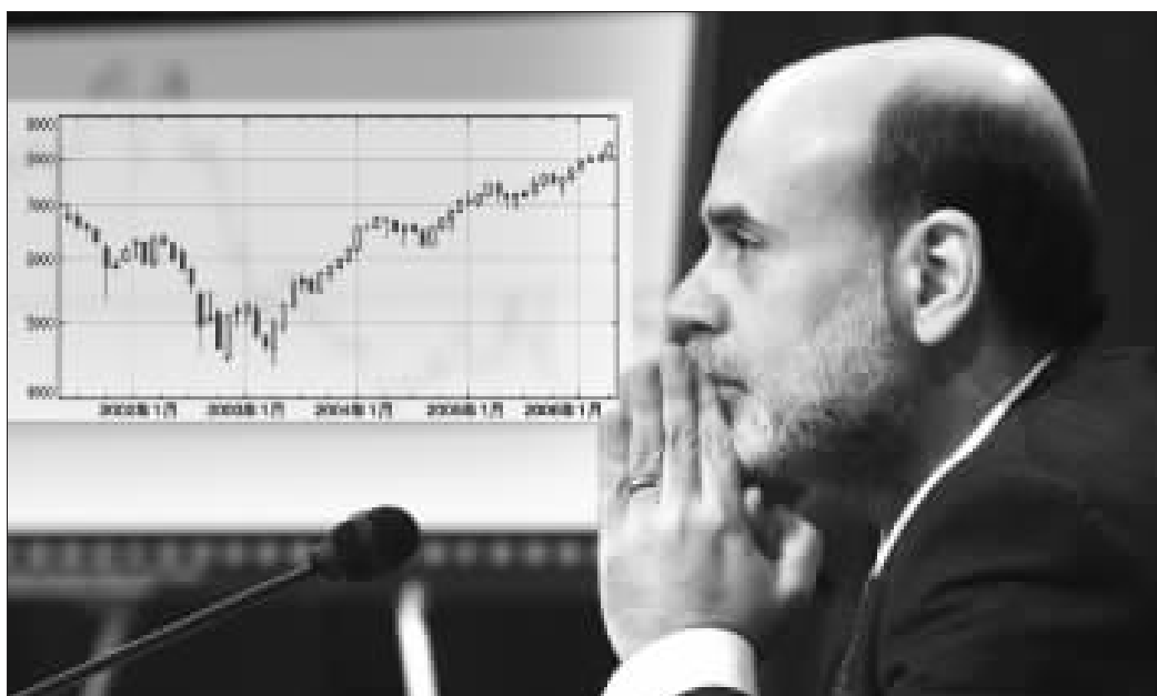
伯南克讲话刺激道指创下新高 张大伟 制图

外汇市场上,投资者对伯南克的讲话反应强烈,纷纷抛售美元。27日美元对欧元汇率跌至7个月低点,美元对日元比价也从1比114.74降到1比114.04。