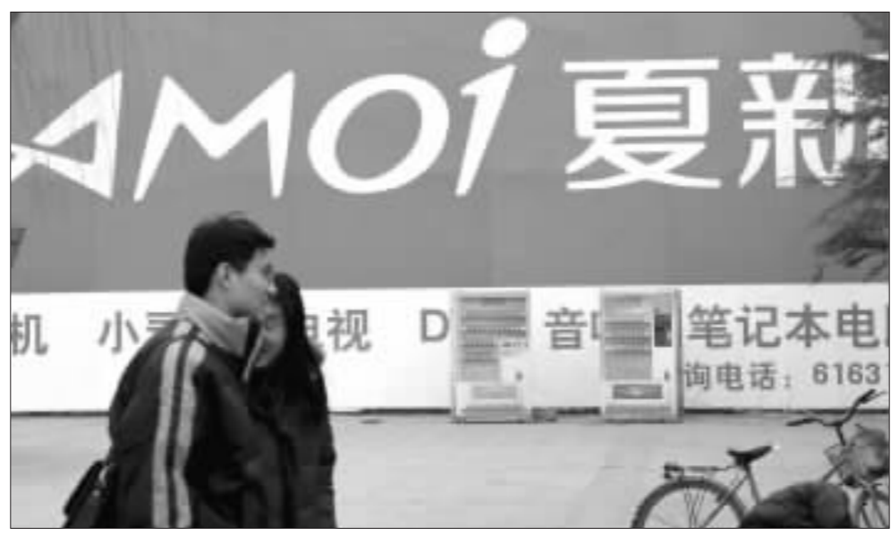
G夏新每股亏1.53元,再次反映了国内手机行业的严峻