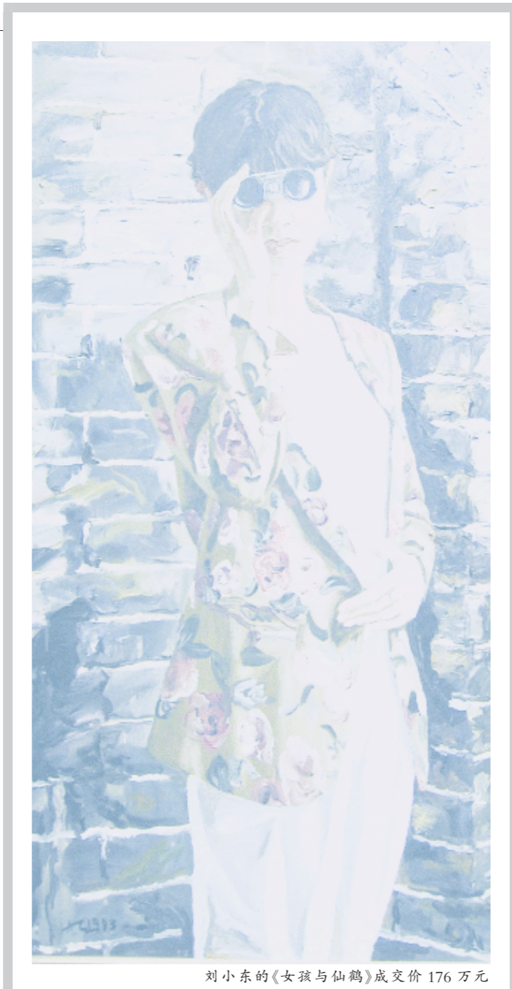
刘小东的《女孩与仙鹤》成交价176万元

再次,本场拍卖的“买气”没有想象中的火爆,很多收藏家和投资者都持观望态度,现在市场中投资者和收藏家的购买心态开始趋于理性,对市场行情有自己的独立判断。这对中国内地的拍卖市场的健康发展有积极的意义。