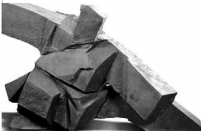
朱铭 1994 年作 太极系列《单鞭下势》之一