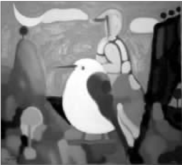
王向明《走向东方》92x100 布面油画

上海是中国油画的渊源之地,其独特的地理文化背景形成了特有的文化品格和韵味。生活在上海的艺术们身处繁华而喧闹的大都会,却以宁静的心态潜心作画,以灵动的思维执着探索心灵的悸动。本次展览展出一批索卡早期及当代经典“海派”艺术家的典藏,其中有一代艺术大师林风眠、张充仁及当代著名艺术家俞晓夫、王向明、杨剑平等优秀作品。