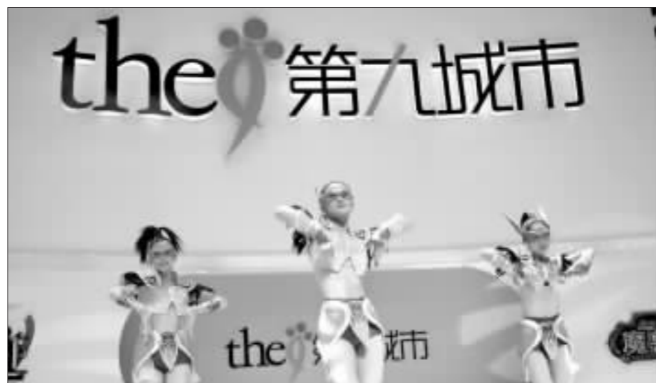
面对“魔兽”带来的高额利润,暴雪公司想独立在中国运营该游戏实属正常 资料图

一位不愿透露姓名的网游公司CEO告诉记者,面对“魔兽”带来的高额利润,暴雪公司甚至想独立在中国运营这款游戏。截至美国时间5月5日,第九城市报收27.08美元,下跌5.76%。