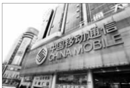
有消息称,黑莓服务将从5月17日起向中国移动用户提供

两个月前,中国移动已经发出了100多个支持黑莓服务的号码进行公测,不过这些号码主要提供给北部等关联单位人士。