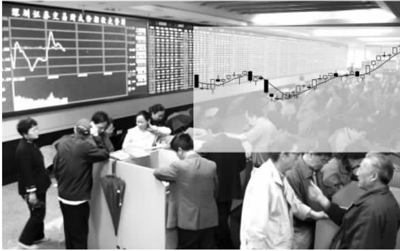
上证综指本周接连跨越1500点、1600点两道坎 郭晨凯 制图

另有一种观点认为,此轮大盘的上涨是对过去一年股改成功实施的一种宣泄,也是在人民币升值预期下A股价值重估的预支。一段时间以来大盘形成的连续放量上涨,彻底扭转了投资者近五年来调整所形成的熊市思维。随着未来新老划断、新股发行的展开,牛熊转折趋势可望全面形成。