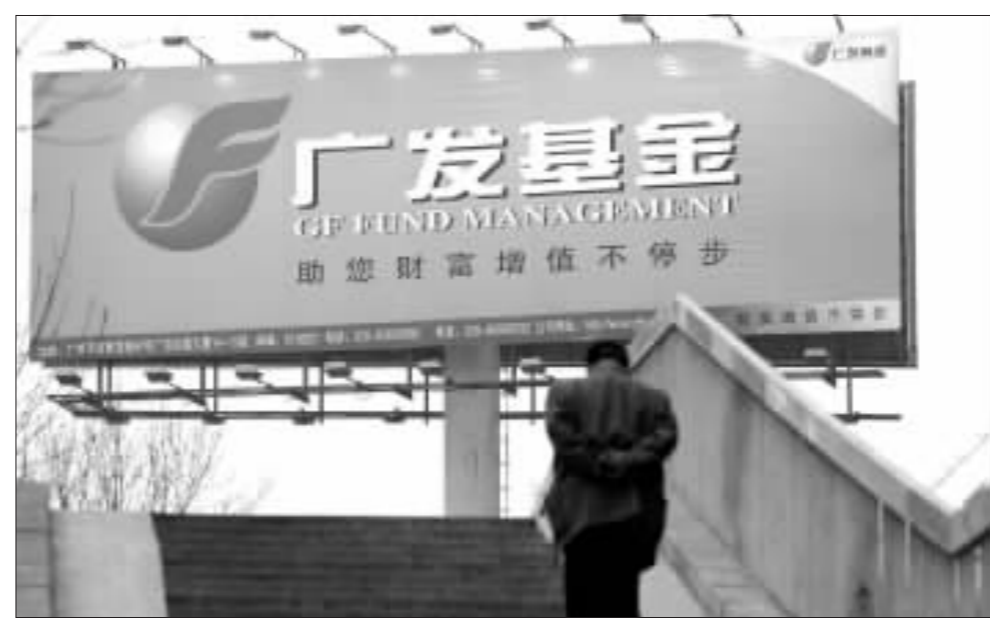
广发策略优选基金能否为投资者带来好的收益,对国内基金公司来说是一个巨大挑战。资料图

着新股发行以及非流通股流通,大盘基金的腾挪空间将得到提升,但管理大规模基金仍是一件极具挑战性的事情,尤其是对于没有类似管理经验的基金公司。