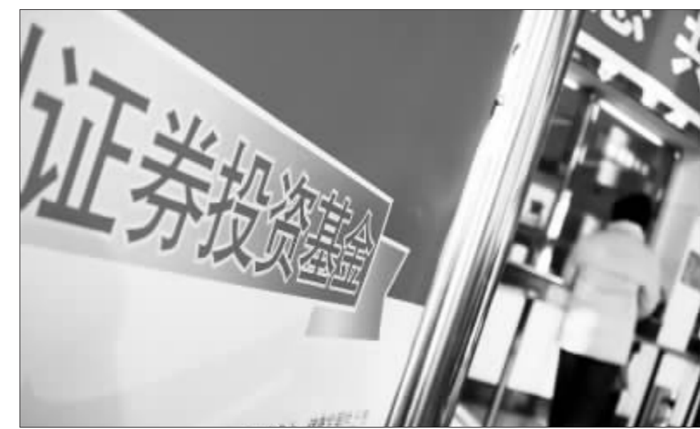
股票型基金发行再现百亿神话引起了市场多方关注 资料图

财富效应是基金发行出现井喷的主要原因。上证指数从1月4日的1163点,涨幅为31%,而同期净值增长率超过50%的基金有易方达策略成长、广发聚丰等19只,而上证