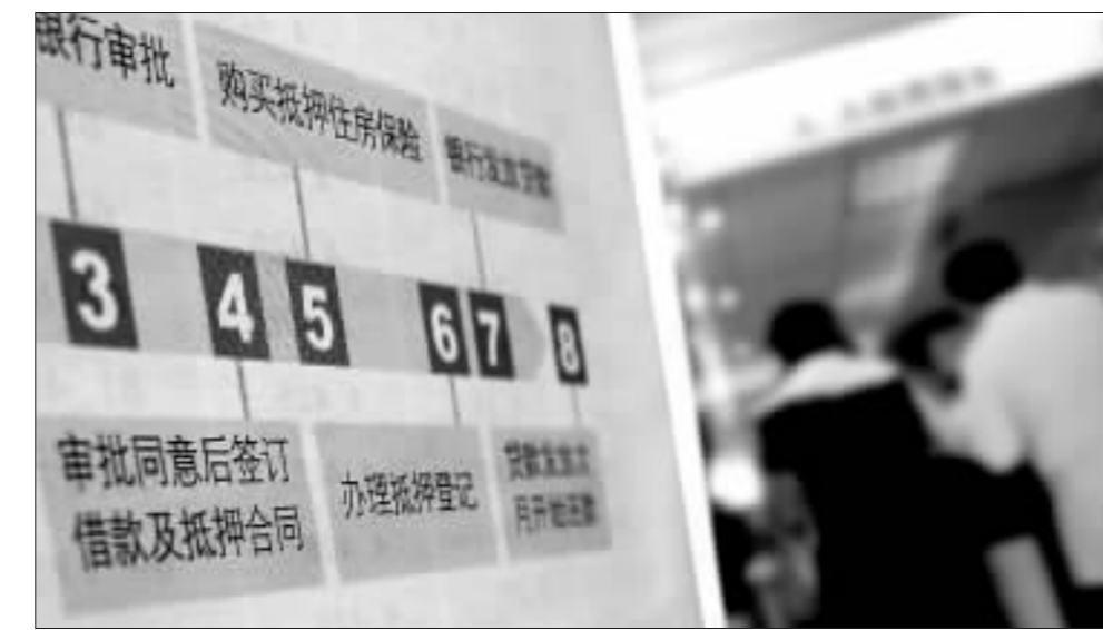
数据显示多家保险公司房贷险收入 4 月出现负数 资料图

业内人士称，由于商业银行纷纷取消房贷险强制制度，以及 4 月中旬的央行出台贷款加息政策，都会进一步加剧房贷险的赤字问题。 上海房贷险递减 公司名称 1-4 月房贷险 4 月房贷险 中国人保 -269.18 -60.99 太保 312.54 69.53 平安 -1,108.91 -391.45 美亚 6.07 1.68 太平保险 -155 -51.53 天安 -1,524.45 -625.4 行业合计 -2,282.53 -792.61 (单位:万元)