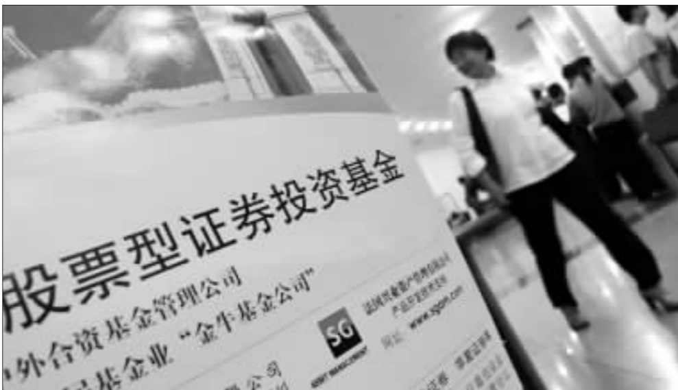
面对火爆的基金发行市场,投资者应根据自身风险承受能力选择不同的基金。 资料图

基金一季报显示,这部分基金在一季度都相当大比例地配置了今年最强盛的有色金属板块,这也是这部分基金净值最近大起大落的主要原因。不过,除了有色金属之外,这些基金持有的其他重仓股今年以来也相当强势,这也充分体现了这部分基金积极主动的投资风格。