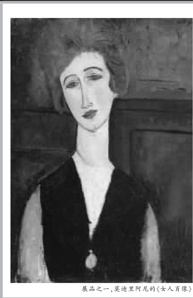
展品之一,莫迪里阿尼的《女人肖像》

派、野兽派、立体派等西方现代主要艺术流派,包括有库尔贝、德加、方丹拉图尔、莫奈、毕沙罗、马奈、雷诺阿、塞尚、高更、凡·高、雷东、勃纳尔、维纳尔、马蒂斯、布拉克、蒙德里安、莫迪里阿尼、毕加索、马格利特、恩斯特等大师的代表作。其中最耀眼的作品有雷诺阿《罗拉莱斯小姐像》(Romaine Lacaux)、莫奈的《系红头巾的女人》(The Red Kerchief:Portrait of Mme.Monet)、高更的《海浪中》(In the Waves)、凡·高的《圣·雷米的白杨》(The Poplarsat Saint-Remy)马蒂斯的《尼斯花季》(Festival of Flowers,Nice)、莫迪里阿尼的《女人肖像》(Portrait of a Woman)另外,雕塑艺术大师罗