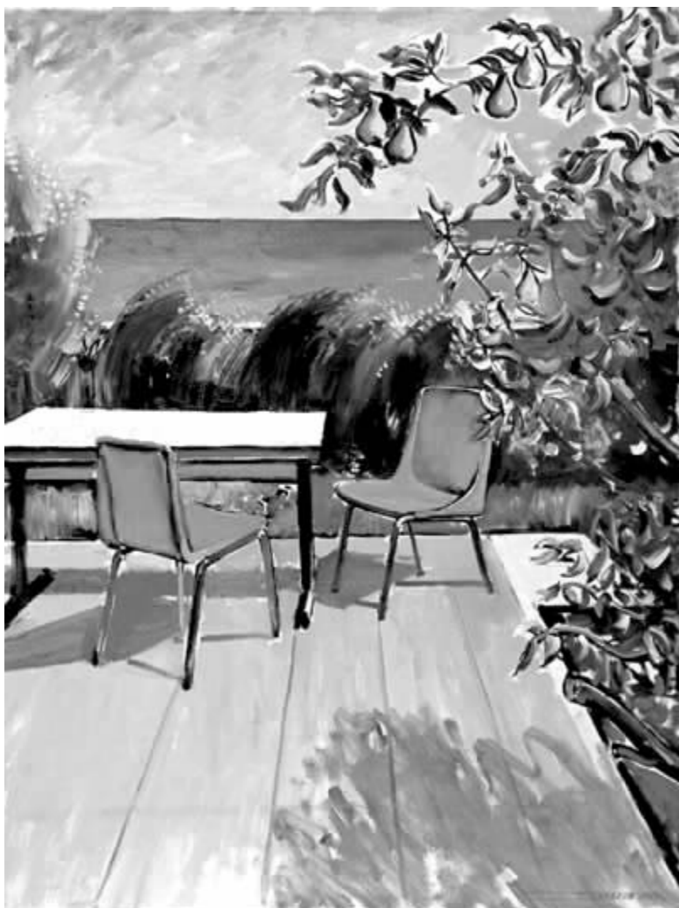
萨拉霍夫:门外一张红椅(油彩画布)