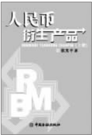
《人民币衍生产品》(上册) 张光平 著 中国金融出版社 2006年5月出版