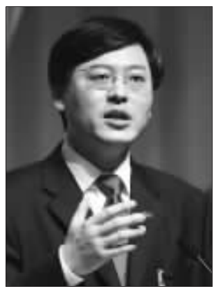
杨元庆在媒体会议中