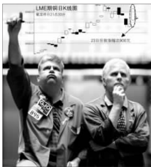
昨日外盘走势也风云突变 张大伟 制图

史性的上涨幅度，全天振幅区间达到1165美元。从当天下午开始，买盘源源不断地涌出，推动铜价急速攀升，电子盘中最高冲至8600美元，逼近上周四创下的历史高点8790美元。不是涨停就是跌停，近几天以来金属期货市场的波动巨大令人难以把握，投资的风险也在逐渐加大，业内人士建议投资者以观望为主。上海金鹏期货研发中心经理杨广喜在接受本报记者采访时表示，近来沪铜震荡激烈，难以把握走势；再加上国内没有电子盘，造成国内铜价跟不上外盘节奏，在这个时候无论是做多还是做空风险都很大。“目前国际期铜走势比较混乱，大起大落，投资者应尽早抽身世外，避免被突如其来行情打蒙。”杨广喜强调，“在期货市场内最重要的就是保存有生力量。”