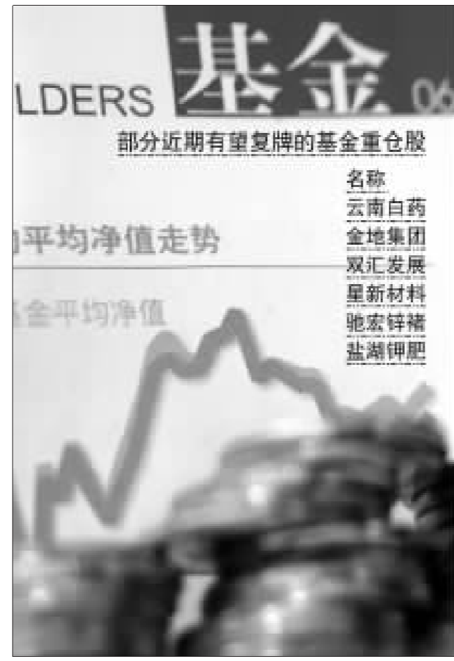
防范套利资金令基金头痛。