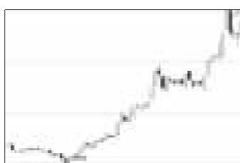
昨日基金指数勉强收出阳线

5月25日,封闭式基金二级市场股价几经震荡之后尾盘拉升使其略显阳线,当日晨星封闭式基金指数收盘1144.2点,较上一交易日微涨0.03%,其中,大规模基金当日表现相对好于小盘基金表现,大规模封闭式基金指数