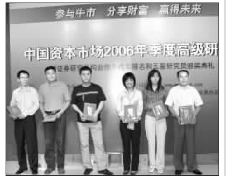
颁奖现场