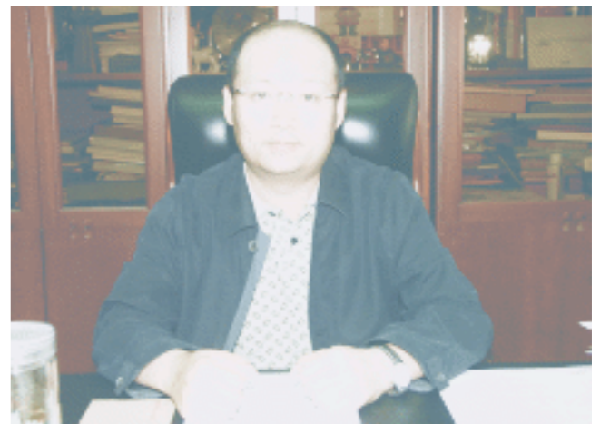
中央电视台李晓明副台长接受笔者采访