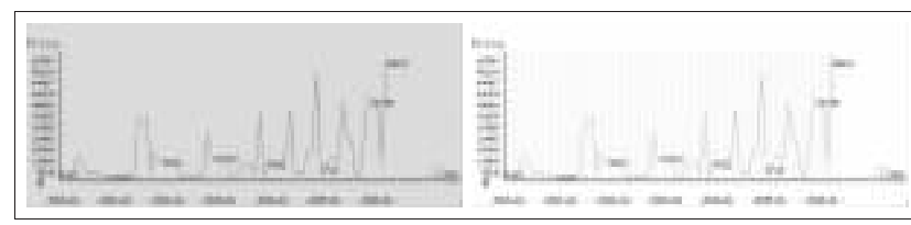
“四王”之一王翬书画作品拍卖成交指数走势图

山水册页(八开)》(1709年作)成交价为638万元,名列其个人作品价格排行榜的第二位,同场拍卖中推出的王时敏、张学曾《溪山远岫》手卷(1638年作)成交价也达到275万元。王翬和王鉴是作品价格指数呈现上升趋势的书画家,中贸圣佳春拍推出的几件作品引人注目,王翬的《荷庄清夏图》手卷(1711年作)成交价为891万元,《仿大痴山水》手卷(1679年作)成交价为550万元,王鉴的两幅作品《溪云初起》立轴(1669年作)、《仿董源山水》手卷(1668年作)分别以440万元和330万元的价格成交。虽然这些作品从单件作品的成交价来讲并没有超越之前的作品,但由于作品尺幅不大,在价格指数上却得到了抬升。虽然整个“四王”的作品价格已达到了高位,走势趋向平缓,但精品成交仍然会给投资者带来惊喜,确保了其拍卖场中的引领地位。