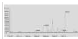
恽寿平书画作品拍卖成交指数走势图

平尺。2005年是恽寿平作品价格没有太大突破的一年,作品的上拍量不少,但成交额并不十分可观。至今年春季,中贸圣佳推出的一件《载鹤图》手卷以1100万元的高价成交,刷新了恽寿平个人作品成交价的最高纪录,并以135.6635万元/平尺的价格使指数曲线呈现出了飞速的增长态势。此外,中贸圣佳推出的恽寿平其他两件作品也以高价成交,《山水花卉册页》(八开)成交价为308万元,《荷塘垂柳》手卷(1670年作)也以132万元的价格落槌。在整个“清初六大家”板块作品价格上涨幅度逐渐缓慢的情势