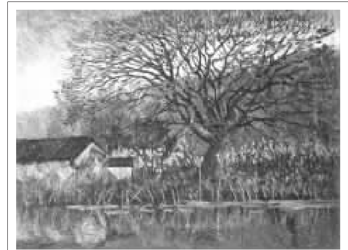
刘海粟书画作品拍卖成交指数走势图

成交纪录。其作品每平方尺的平均价格仅为2.32万元。这个价格比一些当代名家的价格还要低很多。截止到发稿时,据统计今年目前刘海粟国画作品共计上拍的数量为22件,成交18件,成交率为81.8%,作品成交的价格并不高,稍早今年1月份由上海崇源拍出的《熊猫图》以53.9万元成交是成交价最高的作品。可见,通过以上的数据分析,可以明显看出刘海粟国画作品的价格目前还处于底部,尤其被市场(北京)认同的比较迟,通过整理刘海粟作品历年成交情况可以看到刘海粟作品成交大都集中在江浙一带的拍卖公司,北京的拍卖公司并没有对刘海粟先生的作品予以关注。这也是造成目前刘海粟国画作品不高的原因之一。今年春季中国近现代绘画拍卖尤其是“海派”已经呈现弱势行情,在“海派”的阵营中刘海粟的作品无疑是比较值得投资的“逆市黑马”,加之今年3月7日为纪念刘海粟诞辰110周年,在中国美术馆