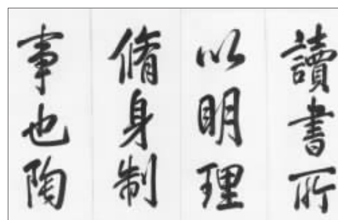
乾隆皇帝 公元1769年作 行楷书益谷考证 册页局部

“清代帝王书法”在市场上出现较多的是康熙、雍正、乾隆三代皇帝的书法作品,几位皇帝都具备很深的汉文化修养,书法作品水平也很高。继上年秋季拍卖的市场旺势,康熙帝的一件《朱子五言诗》立轴在中贸圣佳以418万元的高价成交,这件作品曾在2004年中贸圣佳的拍卖中亮相,当时的成交价为660万元,价格上的下跌显示出古代书画市场调整的整体态势,但这个价格在康熙帝的个人作品价格排行中名列第三位,价格仍在高位。乾隆帝的书画作品数量庞大,是一位书法作品高产的皇帝,这些作品中除了即兴诗文和临古之作外,更有大量的对联和匾额。在2005年秋季拍卖中,康熙帝的《御临董其昌乐志论行书卷》在香港佳士得以超越估价4倍的高价最终以487.6万元成交。在今春拍卖中,崇源国际推出的乾隆帝《行楷书益谷考证》册页(一三二页选十五)(1769年作)的成交价为463.22万元,名列乾隆书法