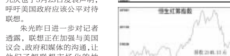
恒生指数成份股行情日报