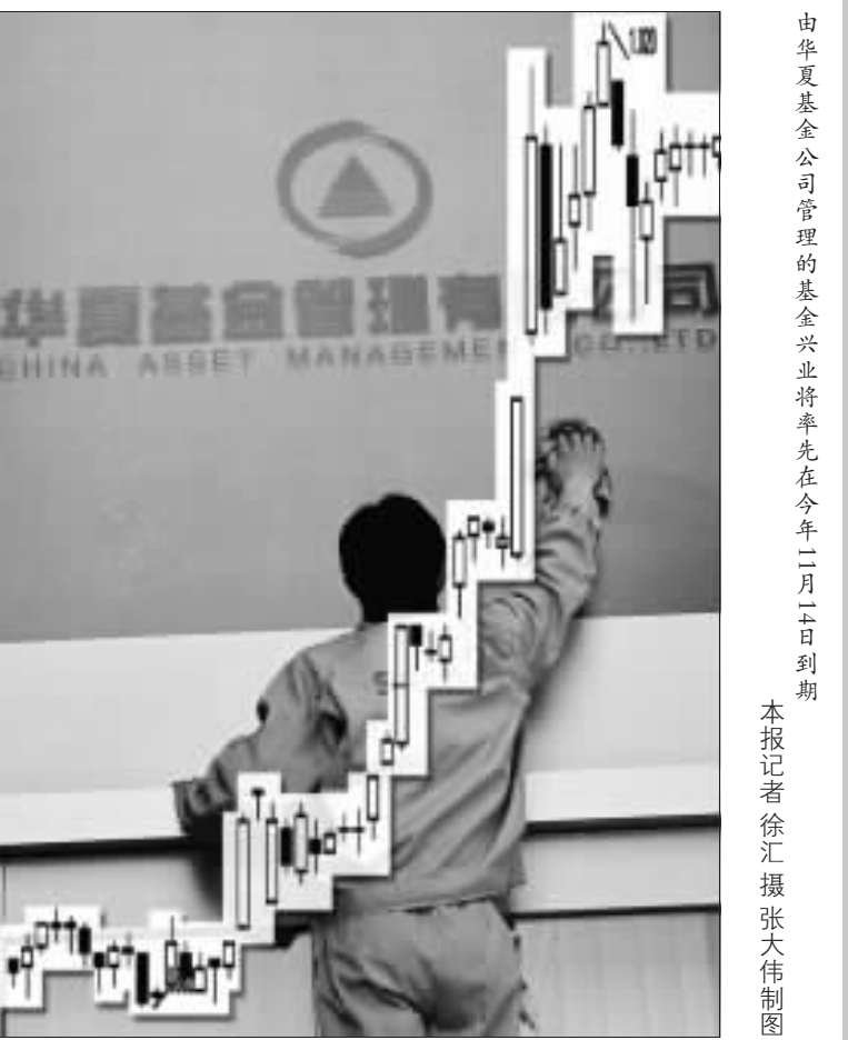
由华夏基金公司管理的基金兴业率先在今年二月二日到期