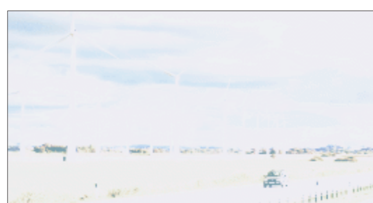
天奇股份已将开发新一代风力发电机叶片摆上议事日程 资料图

天奇股份表示,瑞尔科技长期从事新一代风力发电机叶片生产技术的开发工作,公司创始人 Jim 教授本人是世界复合材料叶片制造技术的创始人。而从市场及行业发展分析来看,随着我国风能市场的扩大,风机制造业逐渐进入高速发展期,而叶片是风力发电机的核心部件,造价约占整个设备的 1/4 到 1/3,目前许多投资者都在寻求