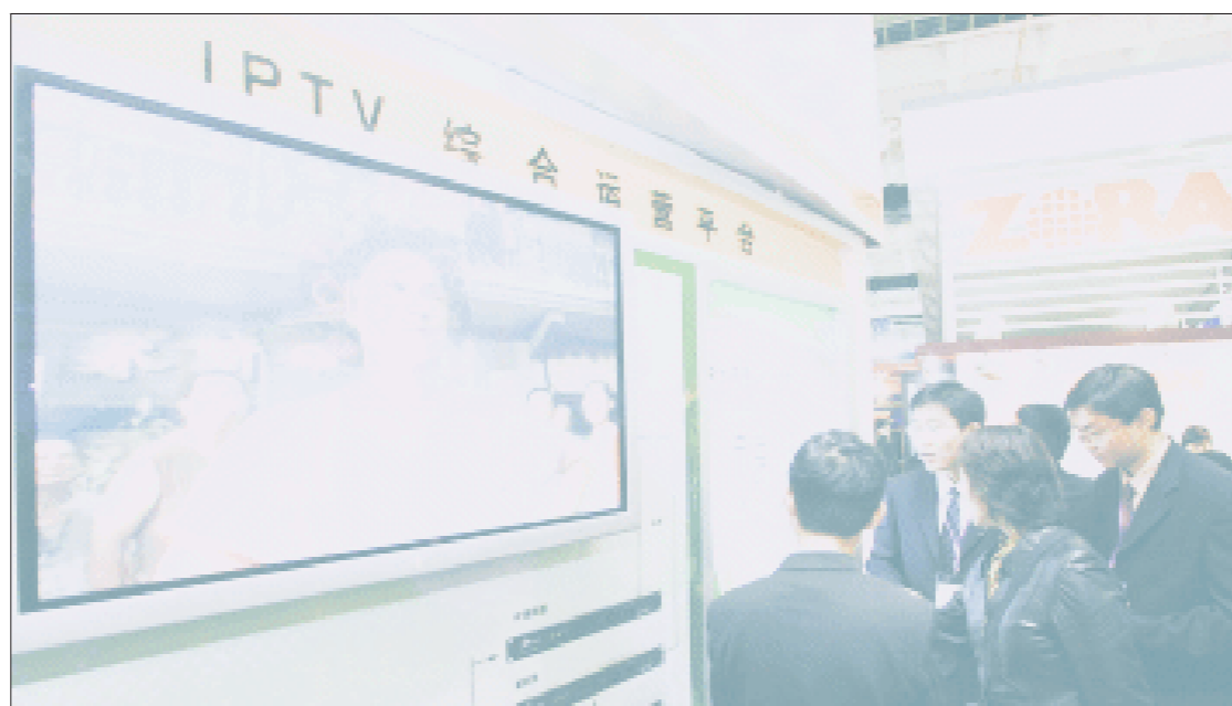
上海将大规模推广 IPTV 资料图

随着此次招标结果落地,国内 IPTV 市场上 UT 斯达康、中兴、华为三足鼎立的态势趋于明显。目前西门子、阿尔卡特等国际厂商在