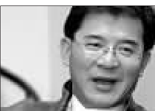
香港瑞安集团董事长 罗康瑞

由于担忧内地频频出台的房地产调控措施,香港市场的内地房产股近期集体走弱。这种负面影响还波及了一些即将上市的房地产新股。