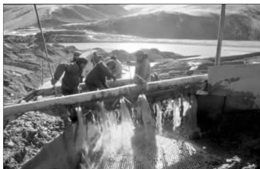
专家认为,影响黄金股的最主要因素仍然是金价 资料图

除了在香港上市的紫金和灵宝黄金(3330.HK)外,目前内地A股市场也只有两只黄金股:G鲁黄金(600547.SH)和G金黄金(600489.SH)。昨日,G鲁黄金证券部一位工作人员对记者表