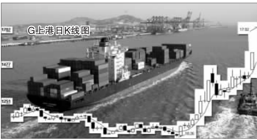
G上港确认整体上市的消息引发整体上市概念股走强 张大伟制图

上证综指昨天报收于1679.13点,下跌5.50点,成交330亿元;深证成指收盘报4294.49点,下跌9.32点,成交191亿元。