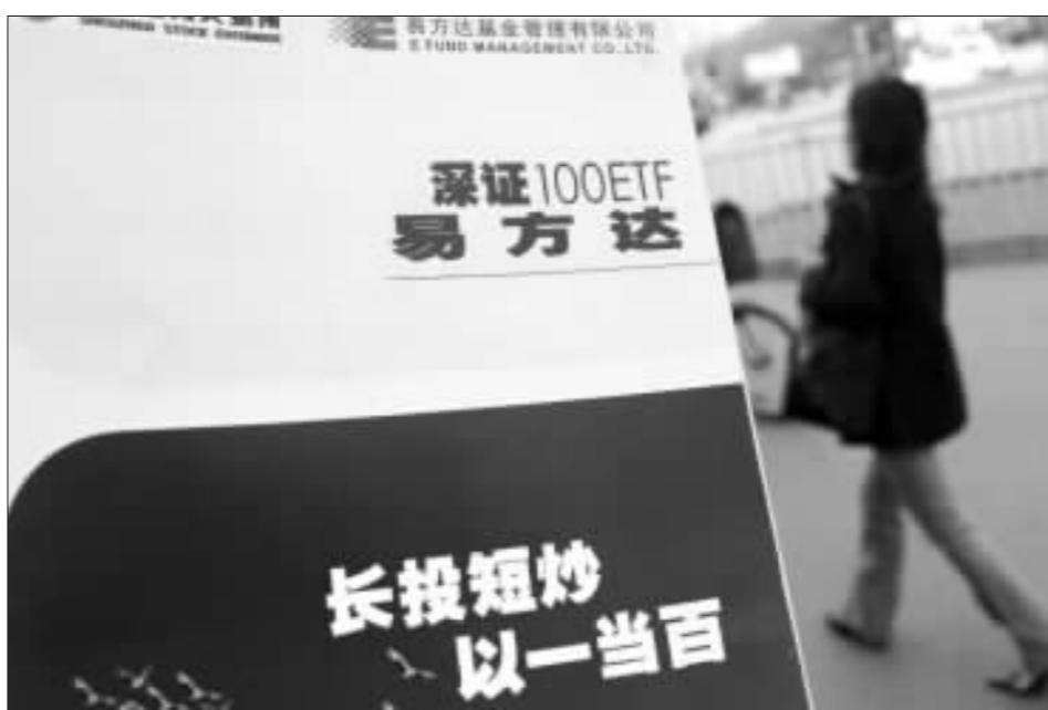
图资料 易方达基金 今年以来,随着行情的火爆,股票型基金的发行越来越受到投资者青睐

外,仅在中行的柜台上就还有泰信中短债等基金在同时发行。4日内破百亿的发行业绩表明,除了基金发行市场的温度依然很高以外,还展现出此前业内并不了解的庞大市场潜力和强烈的分化特征。