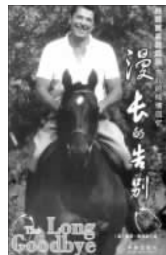
《漫长的告别》 (美)帕蒂·戴维斯著 吴敬译 中信出版社 2006年4月出版