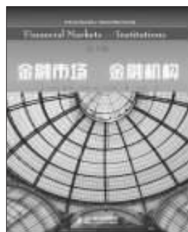
《金融市场与金融机构》(第二版) (美)安东尼·桑德斯 马西娅·米伦·科尼特 著 王中华 译 人民邮电出版社 2006年1月出版

括五大部分内容。首先,作者从总体上介绍了与金融市场和金融机构相关的基础知识,其中包括金融市场的种类、金融机构的功能、金融市场和金融机构对经济发展的作用、货币的时间价值、利率水平的决定、证券的估价、联邦储备系统及其货币政策等。随后,作者对包括货币市场、债券市场、抵押市场、股票市场、外汇市场和衍生证券市场在内的各种证券市场作了总体分析,讨论各种证券市场的主要特点、市场参与者、证券交易种类和交易程序等内容,还分析了利率、通货膨胀和外汇汇率的变化对金融机构风险套期保值决策的影响。接下来的第三部分内容中,作者集中分析了存款机构的业务,商业银行和储蓄机构的主要特征及最新发展趋势,存款机构的财务报表以及分析这些报表时所采用的一些比率等等,在介绍金融机构业务活动中所面临的一些监管法规时,重点分析了监管法规最新的变化所带来的影响。第四部分介绍保险公司、证券公司、投资银行、基金公司、共同基金以及养老金等其他主要金融服务行业的重要特征及监管内容。最后,作者详细分析了现代金融机构所面临的各种风险——信用风险、流动性风险、利率风险、市场风险、表外风险、国家风险、技术风险和破产风险,以及管理这些风险的各种策略。