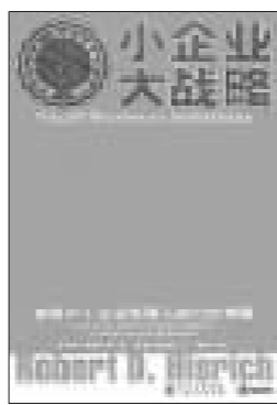
《小企业大战略》 破解中小型企业经理人的十三大难题 (美)罗伯特·希斯里奇著 上海人民出版集团 2006年5月出版 胡月健译

成功不分大小。在硝烟弥漫、危机四伏的商战中,那些坐拥亿万资产、呼风唤雨的巨鳄固然是令人敬佩的胜者;而灵巧多变、追求精专的小企业一样是优秀企业的典范。不可能每个人都成为比尔·盖茨或是迈克尔·戴尔,但是每个人都能成为成功的自己,成为一个优秀的企业家或是小型企业经理人。不过,从筹集资金并建立一支优秀的人员队伍,到发现与探索一个特定的市场,有些问题始终纠缠着小企业业主和经理人,而且结果往往是天壤之别。国际知名创业管理学者罗伯特·希斯里奇通过与世界各国一些创业家和小型企业经理人的访谈,归纳出困扰小企业发展13个问题,比如,怎样才能找到合适的顾客,而且让他们愿意购买?为什么不能把一些一线的销售转化成企业最终的利