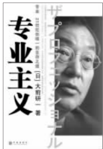
《专业主义》 21世纪你唯一的生存之道 (日)大前研一 著 夏立杰 译 中信出版社 2006年6月出版