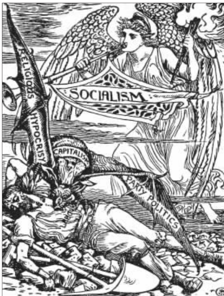
资本与劳动 克拉纳

“中国的机会太多,以至于很难有中国的企业家专注于某个领域,并在该领域作出卓越的成绩。但专