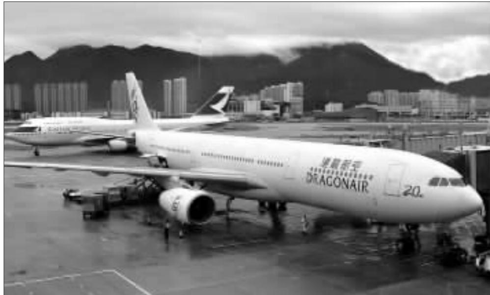
收购港龙后,作为母公司的国泰是否会与港龙抢夺香港与内地间市场呢? 资料图

云山雾罩的国航、国泰、港龙股权整合一事,昨日终于有了结果。昨天早上,国航、国泰、太古、中信泰富和中航兴业联合发布公告,宣布了上述几家公司理顺股权关系的方案。