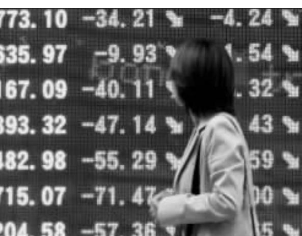
日本股市一片惨淡