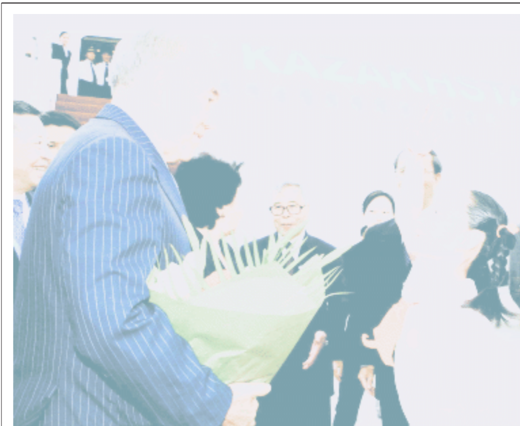
哈萨克斯坦总统第一个抵沪

作为最早到期的封闭式基金,基金兴业到期日为2006年11月14日。截至6月9日,兴业基金的单位净值为1.0821元。昨日二级市场收盘价为1.017元,按上周五的净值计算,基金折价率约为6%。复制基金首张“准生证”可望签发 详见A8