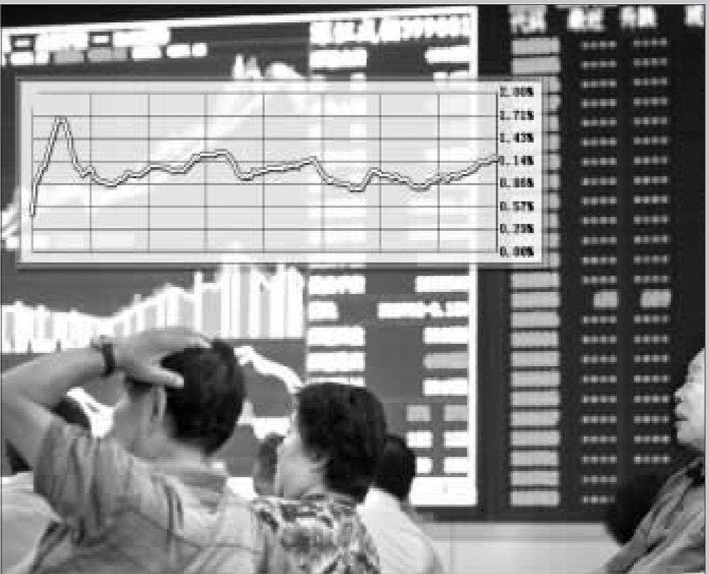
受到基金兴业“封转开”破题的刺激，沪深两市封闭式基金指数昨日逆市飙升