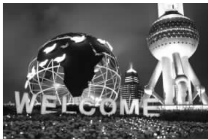
◎浦东东方明珠塔在夜光下璀璨夺目