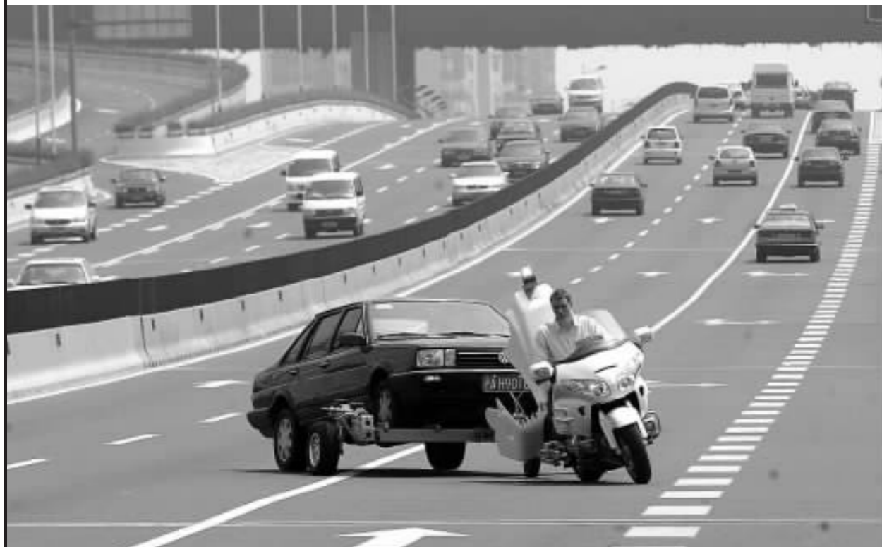
6月12日,一名工作人员在演示使用大功率摩托牵引清障车将“故障车”拖离事故现场,该清障车是从瑞典进口而来,用于确保上海合作组织峰会期间的道路通畅。