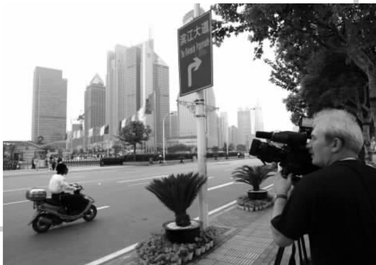
6月13日,一名俄罗斯电视台记者在上海街头拍摄