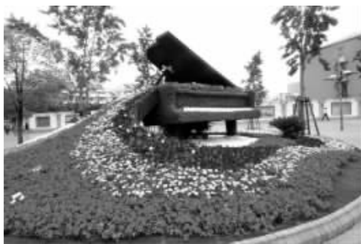
◎浦东街头绿地的园林雕塑景观设计独特、造型新颖