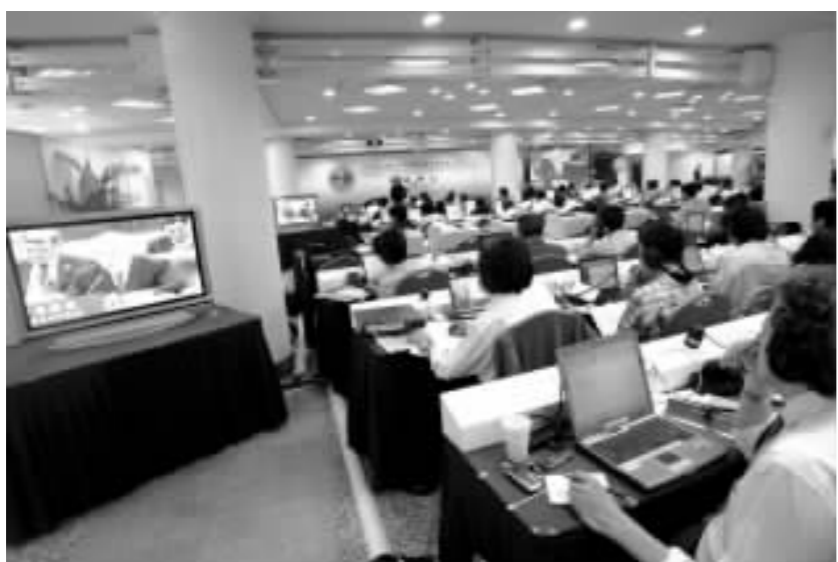
6月15日,上海国际新闻中心,记者观看现场直播的上海合作组织峰会画面。