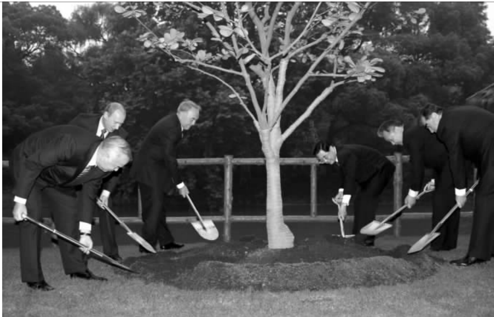
6月14日,为纪念上海合作组织成立5周年,中国国家主席胡锦涛、哈萨克斯坦总统纳扎尔巴耶夫、吉尔吉斯斯坦总统巴基耶夫、俄罗斯总统普京、塔吉克斯坦总统拉赫莫诺夫、乌兹别克斯坦总统卡里莫夫在上海共植纪念树。