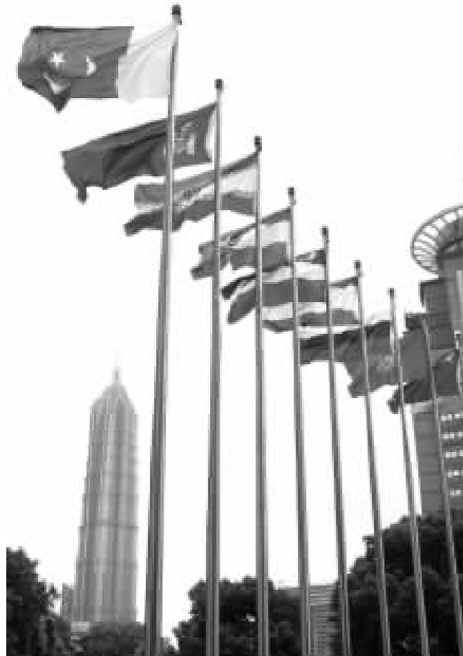
◎参加上海合作组织峰会的成员国国旗迎风飘扬