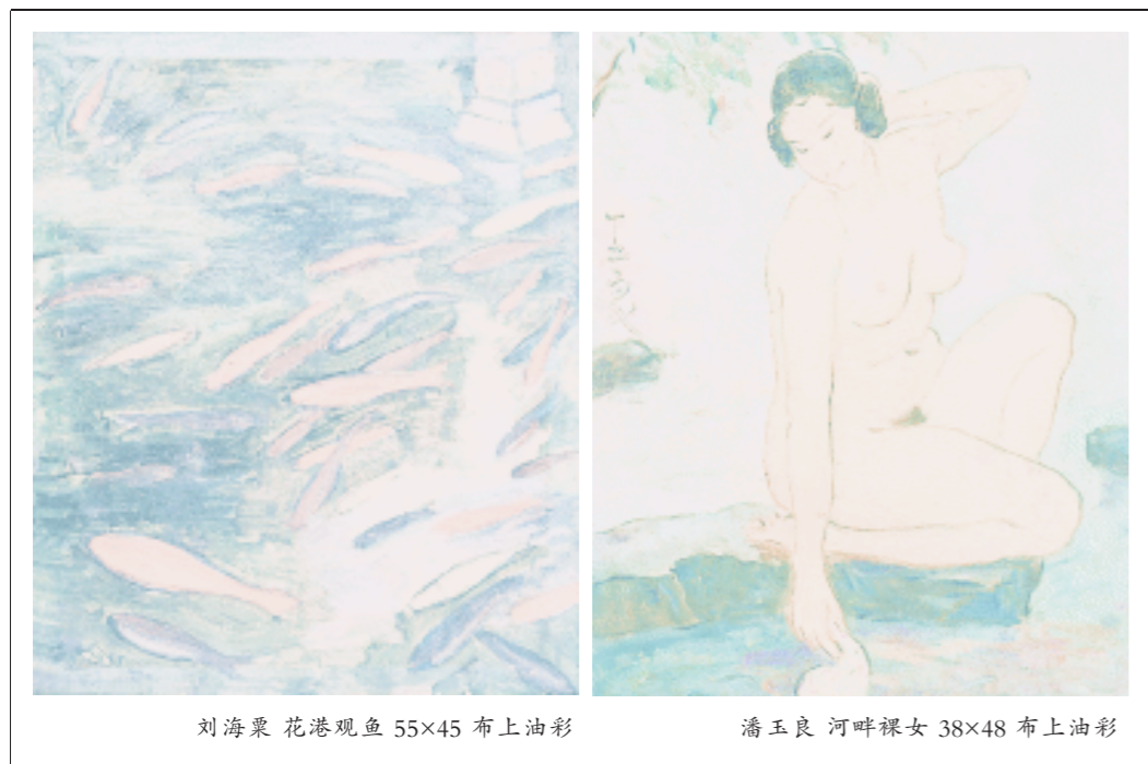
刘海粟 花港观鱼 55x45 布上油彩