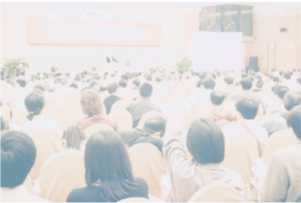
嘉德2005年春季拍卖会激烈竞价