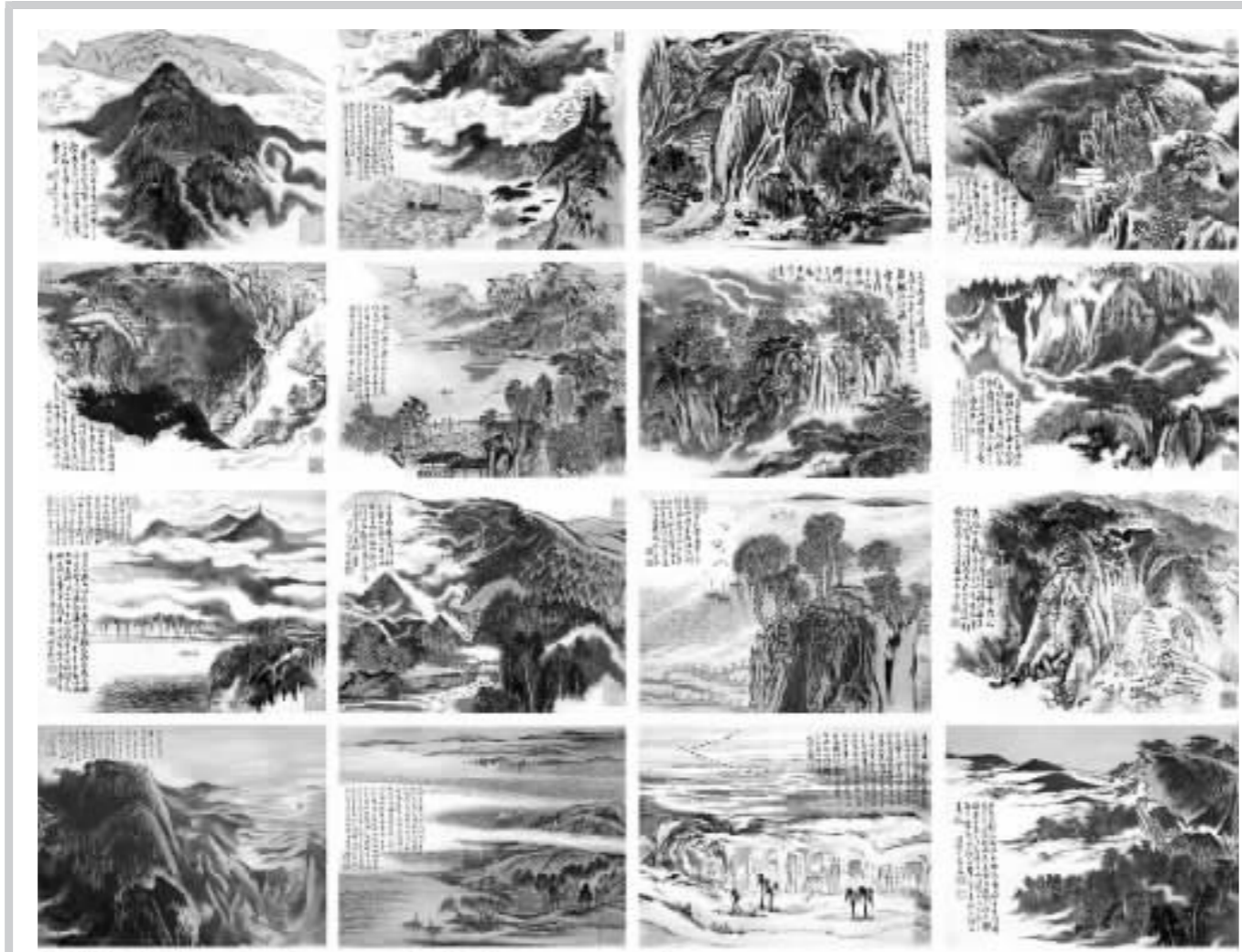
陆俨少《名山图集锦》(册页)

徐悲鸿的《吼狮》以363万元成交,他的另一幅《天马行空》以253万元成交,这两个成交价分别位列该专场成交价格的第二名、第三名。这两幅作品都是徐悲鸿先生最为擅长的动物题材,作品也生动精彩,堪称徐悲鸿先生的精品之作。更为重要的是此次保利上拍的徐悲鸿的作品都得到了徐悲鸿先生的夫人廖静文女士的认可,并且每幅作品都有廖静文女士的认定书,这无疑使买家能够“买得放心、买得称心”。而且较之陆俨少《名山图集锦》的800最低估价这两幅作品的估价也比较合理,其中《吼狮》的估价是150-180万元、《天马行空》的估价是120万-140万元,合理的估价作为作品创造高价奠定了基础。该专场的齐白石的《花