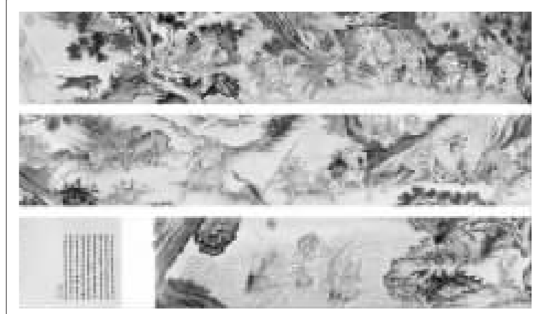
夏圭(传)《搜山图》手卷