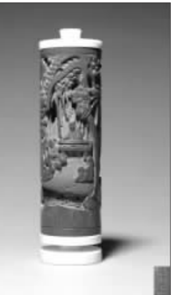
清康熙《顾玉制竹林七贤竹香筒》