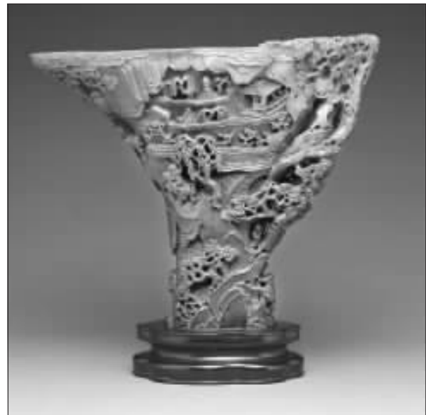
明晚期 方柱石制春凤得意图犀角盃