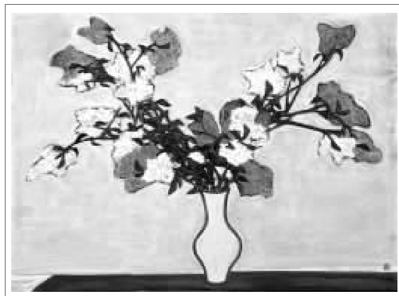
常玉《明黄瓷瓶中盛开的花朵》