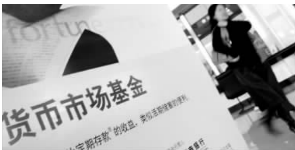
随着中行IPO的结束，货币基金已度过了最艰难时刻 资料图

在IPO环境下的货币基金，流动性和收益率成为不可兼顾的目标。产品“同质化”并不妨碍货币基金在基金公司整体管理目标上的“差异化”。在基金管理公司中，一些