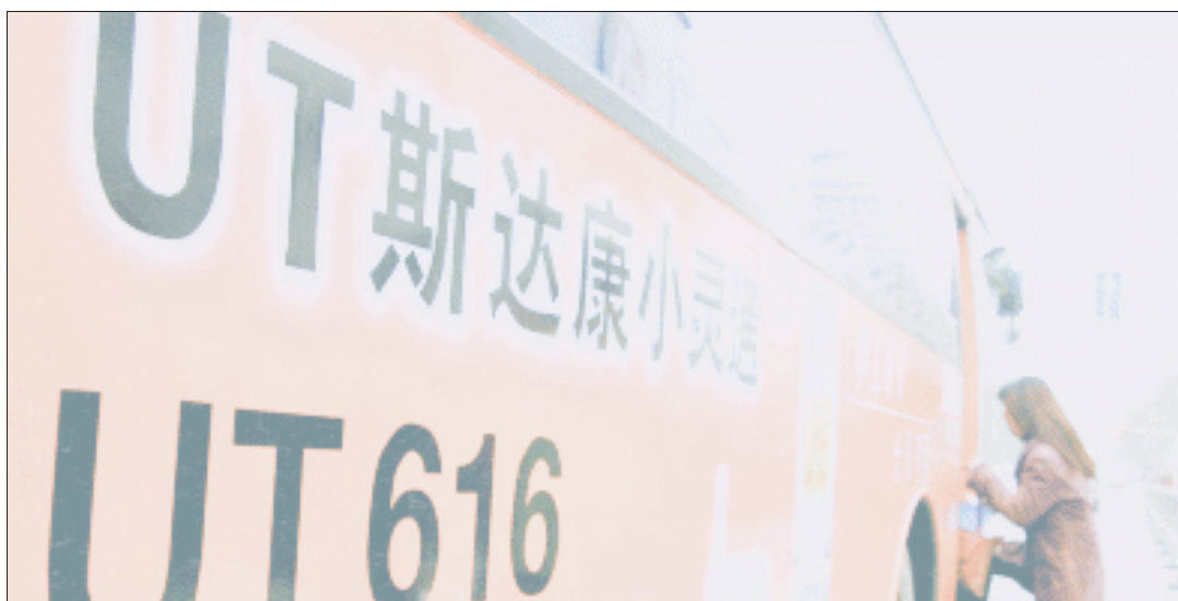
卷入海外行贿事件,使UT斯达康雪上加霜 资料图

UT斯达康表示,公司将就上述事情展开调查,目前已与美国司法部及证券交易委员会进行了沟通。据了解,UT斯达康此次主要涉嫌违反美国《反海外腐败法》。该法案主要目的就是防止海外公司采取贿赂等不正当手段来提升业绩。而UT斯达康是一家美国硅谷注册公司,受美国法律管辖,而涉嫌代理商和UT斯达康存在股权和业务上的关系,所以