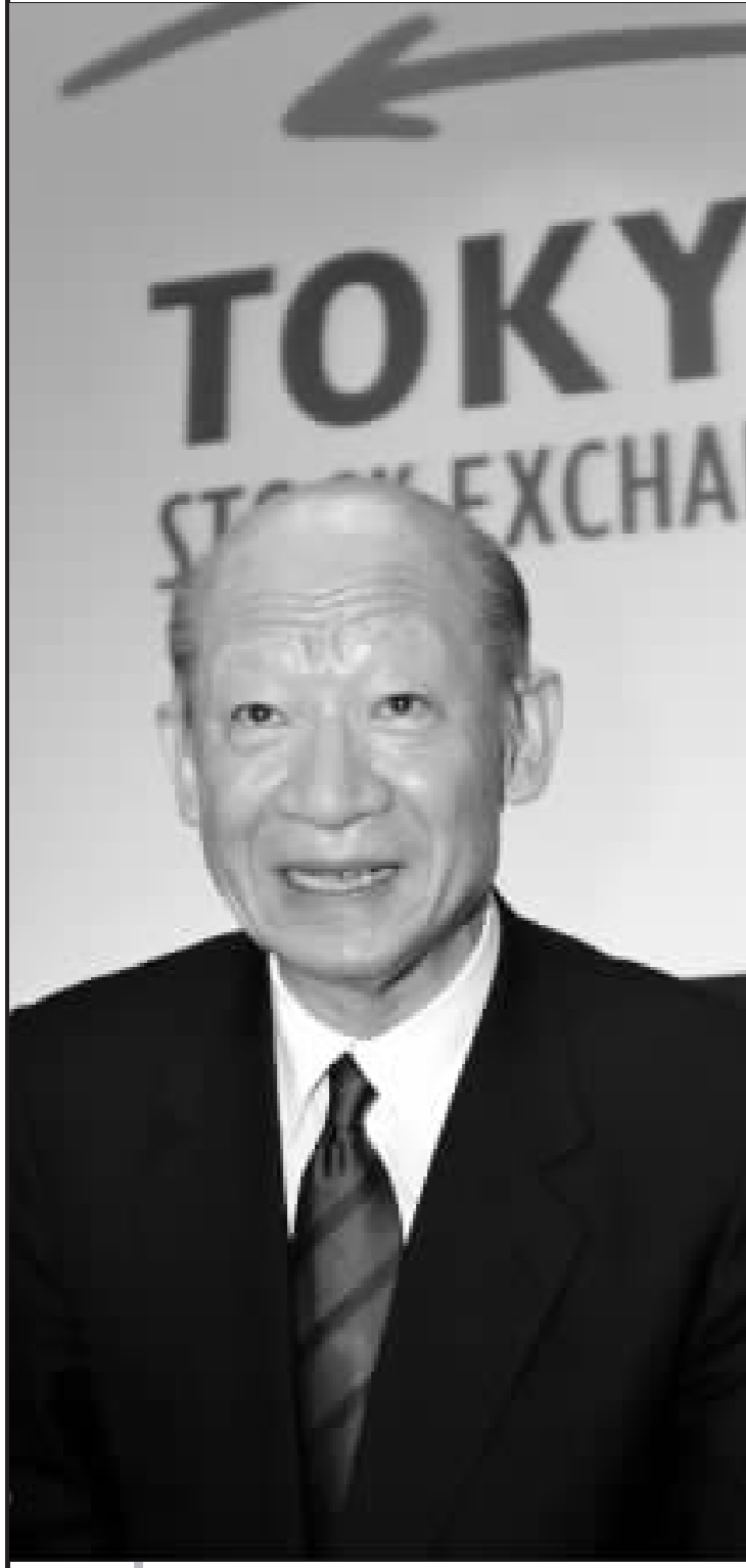
西室泰三野心暴露无遗 资料图