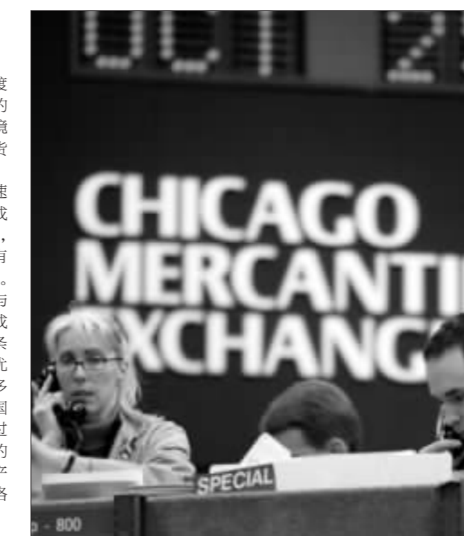
世界最大衍生品交易所之一——芝加哥商品交易所一角。随着股指期货的上市,中国期市也将出现这样的机构

公司可能越来越多地参与期货市场。在全流通之后,市值是重要的参考指标,上市公司高管期权也要看市值,如果市值与公司业绩完全背离,而且没有单只股票的期货期权的话,肯定要用股指期货,股指期货上市使上市公司参与期货市场的可行性更大了。另外,股指、利率、汇率期货陆续推出,证券公司、基金公司以及更多的机构将会进入期货市场。