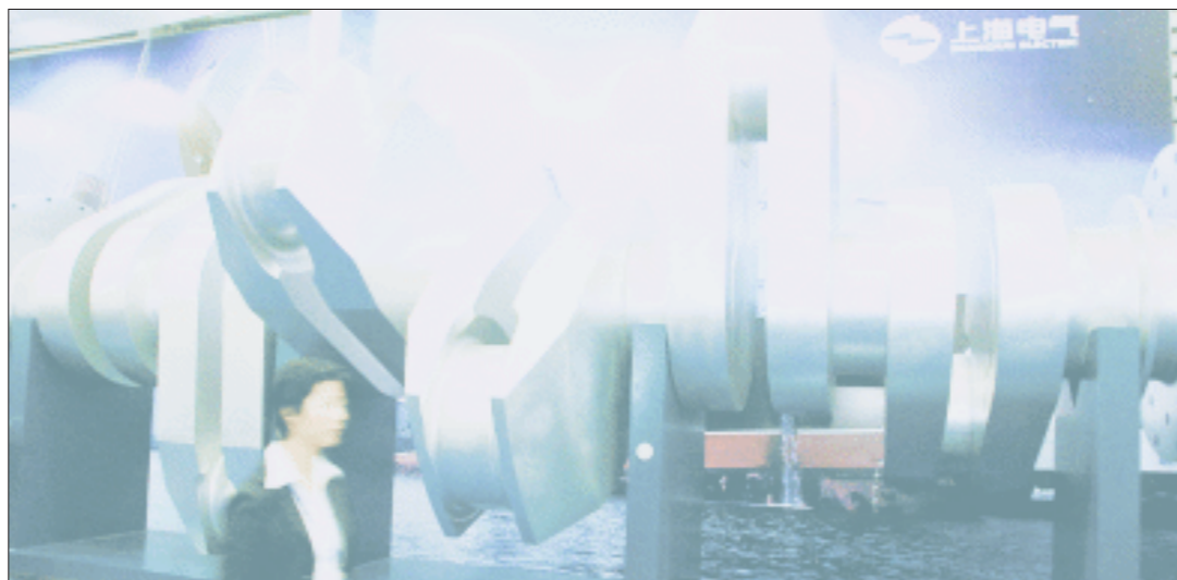
上海电气整合旗下三家公司有利于做大做强电力设备板块 资料图

11名成员,其中3名将由上海汽轮机厂委任;上海汽轮机厂和上海电站各委任2名,另外4名由西门子委任。