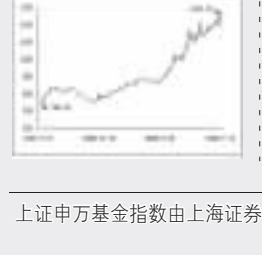
上证基金指数趋势图