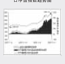
上证申万偏股型开放式基金