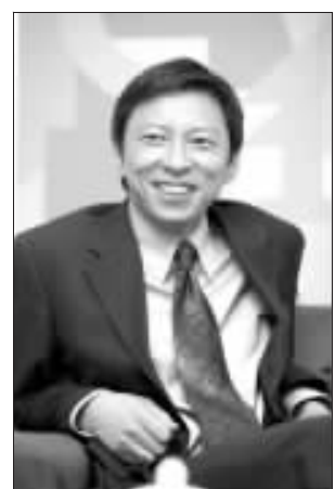
在27日正常交易中,搜狐收报于22.06美元,比上一交易日下跌0.65美元,跌幅为2.86%。