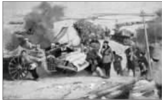
《支援前线》崔开玺 1993 年作

文革艺术水平的特大型国家级画展, 并为此出版了画册。《建立一个强大的海军》刊登在第六页, 画中的人物造型逼真, 气势庞大, 仍旧是红、光、亮、高、大、全的政治画风格。这件作品具有典型的文革色彩和划时代意义, 反映了重大的主题, 见证了历史风云, 成为中国文革绘画史中的标志性作品。