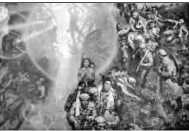
《长征之路》沈尧伊 1981 年作

上世纪九十年代初期的中国美术界, 仍旧是革命现实主义作为艺术主流一统天下的局面, 抛弃了政治与意识形态的