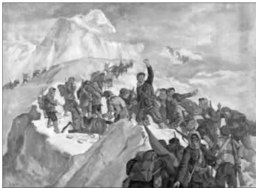
《红军过夹金山》冯法祀 1950 年作

二万五千里长征已经成为我们民族精神的一部分。今年, 我们又迎来了中国工农红军二万五千里长征胜利七十周年和中国人民解放军建军七十九周年的伟大时刻。伴随着民族的苦难历程一路走来, 中国的艺术创作也经历了一次名副其实的漫长征程, 把沿途的辛酸、苦难、探索、挫折、骄傲, 以及反省和奋起永远地留在了画卷之中。